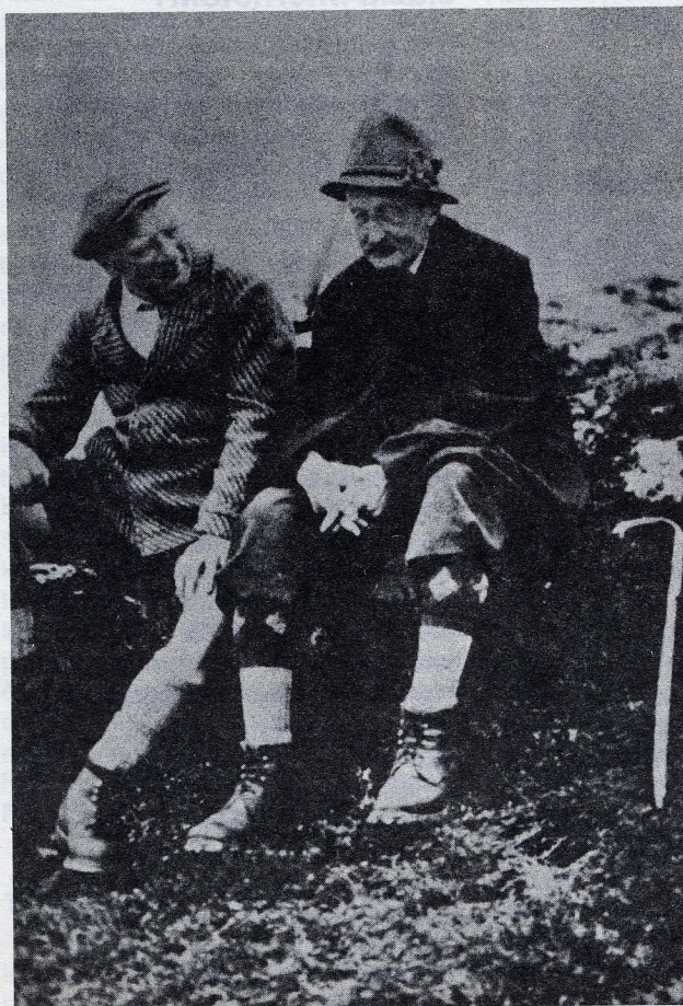
Slika 1. Max Planck (1940.?) u društvu sa g. Fickerom (kojim?) na izletu kod mjesta Walda u planinskom masivu Pinzgauu u pokrajini Salzburgu, Austrija.

Prvo javno objavljivanje ove fotografije u svijetu uz pomoć Zentralbibliothek für Physik u Beču, Austrija.